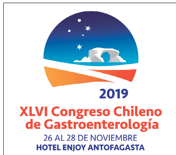
Fotografía 12. Congreso Chileno de Gastroenterología 2019.

Desde el año 2016 y en convenio con la Sociedad Chilena de Medicina Interna se han desarrollado cursos 100% on line . Los cursos de Tubo Digestivo Alto, Hepatología y Tubo Digestivo Bajo ya han tenido varias versiones nacionales e internacionales con un importante número de alumnos que pueden actualizar sus conocimientos en Gastroenterología. En forma autónoma, la SChGE ha desarrollado cursos on line de Técnicas Básicas en Endoscopia Alta con