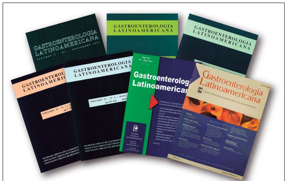
Fotografía 8. Revista Gastroenterología Latinoamericana 1990 -2019.