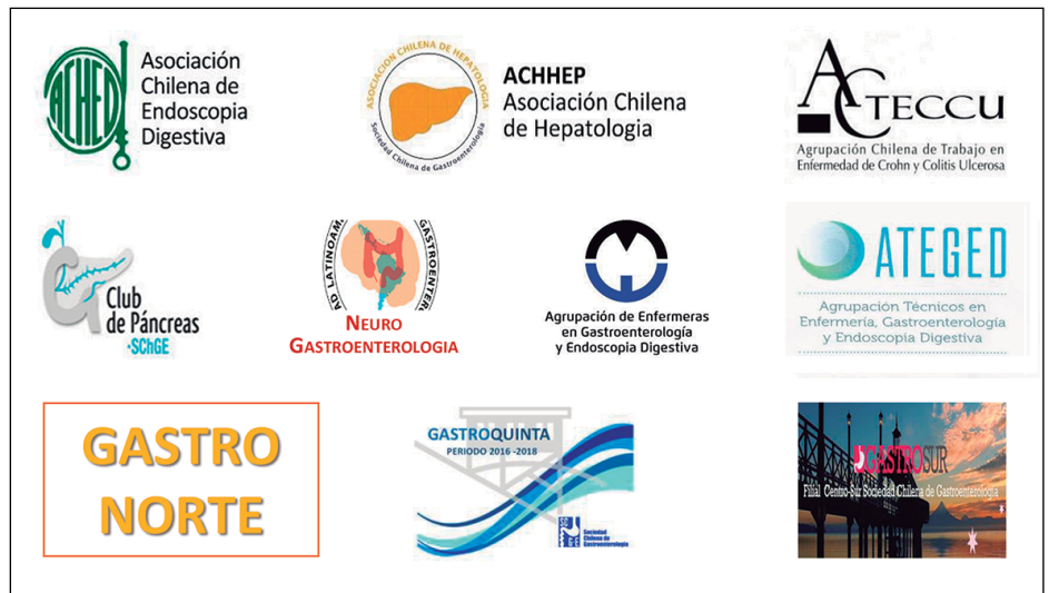
Fotografía 6. Asociaciones, Agrupaciones y Filiales que son parte de la SCHGE.