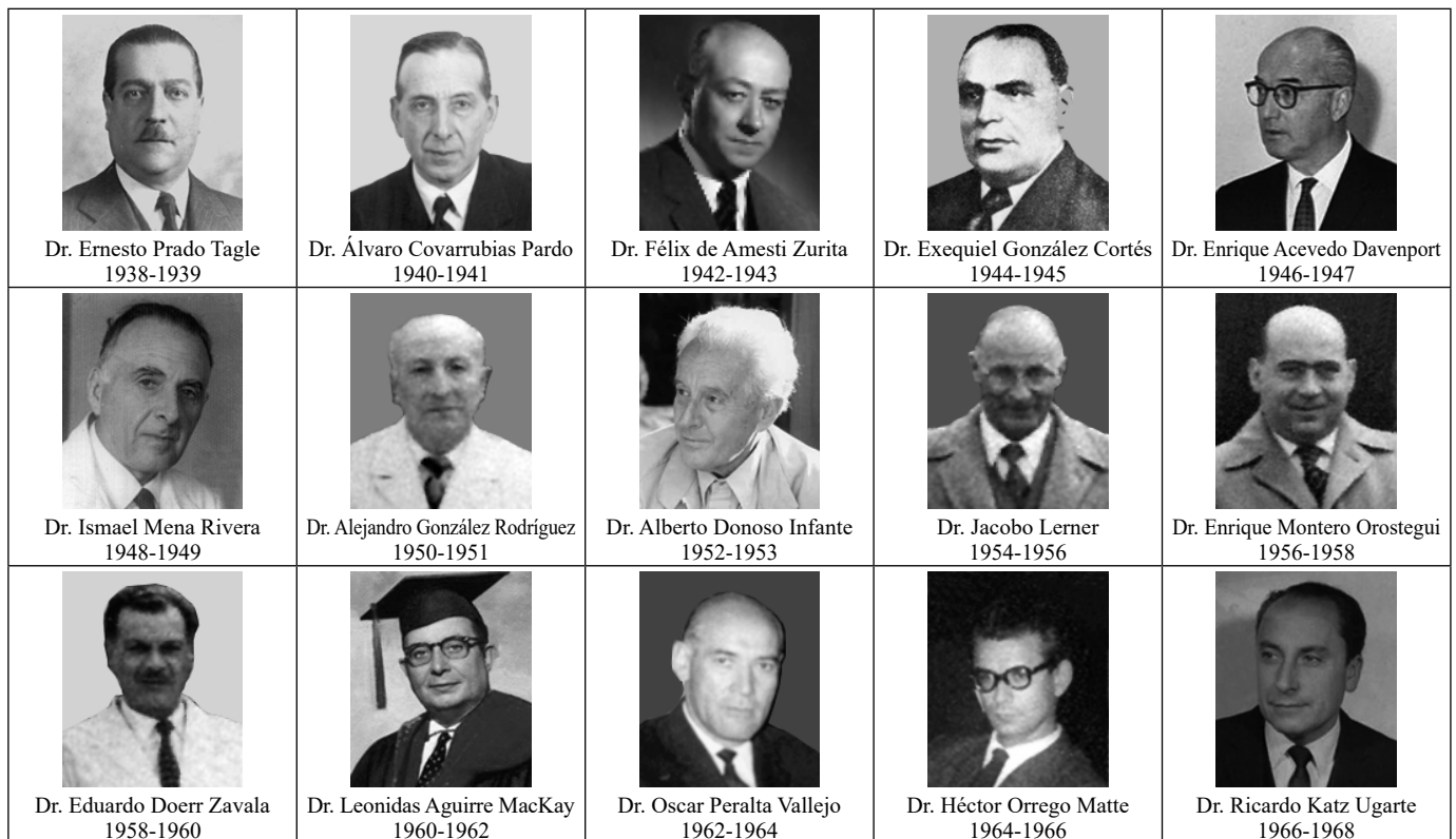
Tabla 1. Presidencias SCHGE