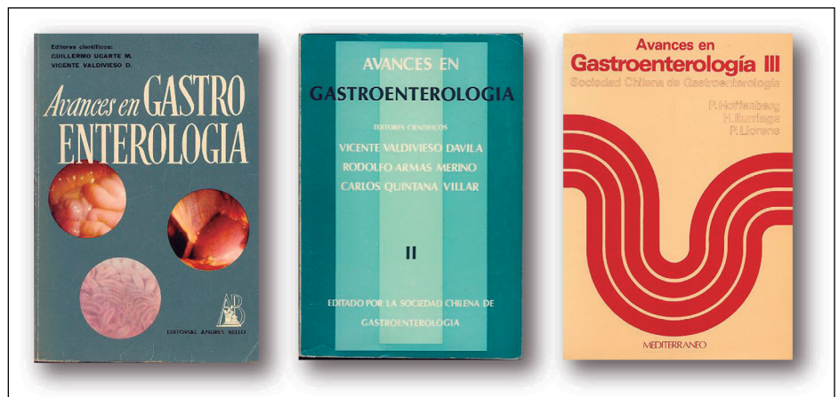
Fotografía 7. Serie de Libros Avances en Gastroenterología 1972-1979-1985.