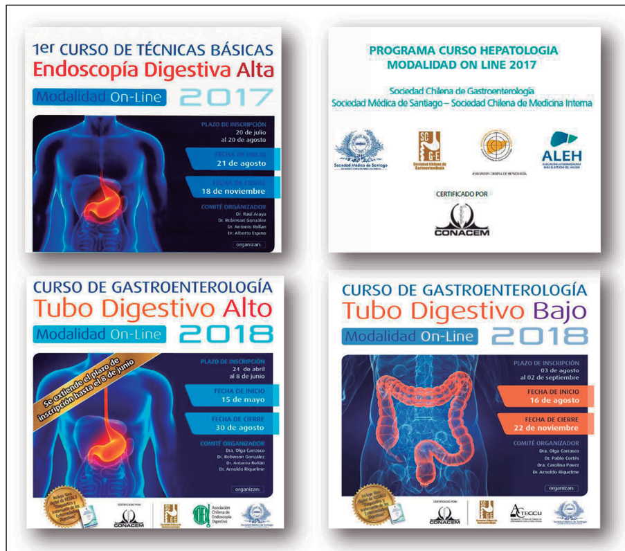
Fotografía 15. Cursos modalidad on line 2016-2017-2018.