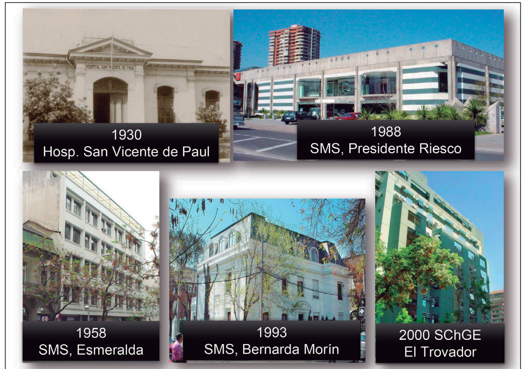
Fotografía 11. Sedes de la SCHGE