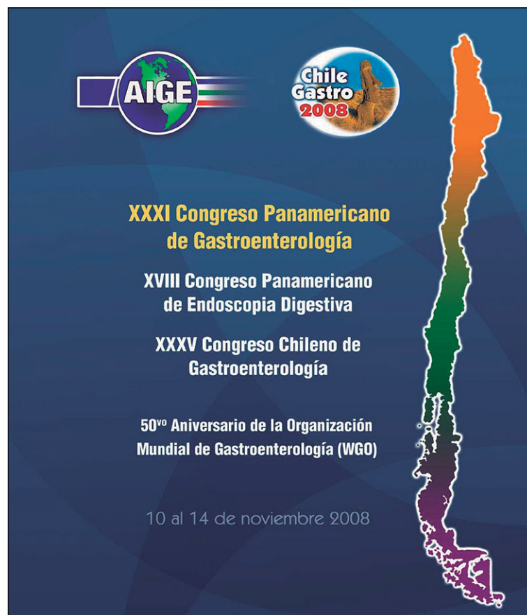
Fotografía 4. XXXI Congreso Panamericano de Gastroenterología.

El libro de bolsillo "Normas de Diagnóstico y Tratamiento de Enfermedades Digestivas" fue publicado por primera vez el año 1989, bajo la presidencia del