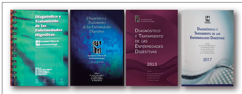
Fotografía 10. Manual Diagnóstico y Tratamiento de las Enfermedades Digestivas 2002-2017.

en Servicios Clínicos, en postgrado y pregrado como texto de consulta habitual (Fotografía 10).