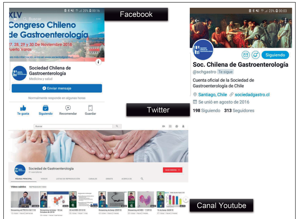
Fotografía 13. Redes Sociales SCHGE.