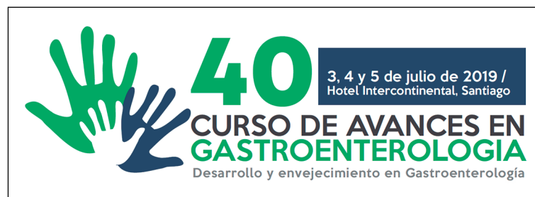
Fotografía 5. Cursos de Avance en Gastroenterología 2019.