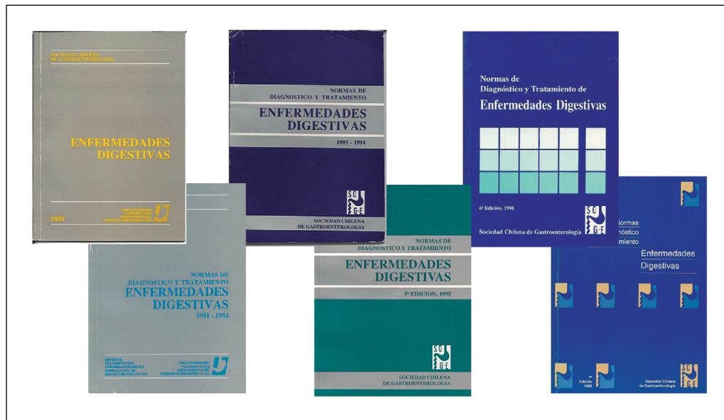
Fotografía 9. Normas de Diagnóstico y Tratamiento 1989 a 1998.